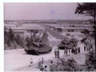
Centurion kampvogne på vej til øvelsespladsen