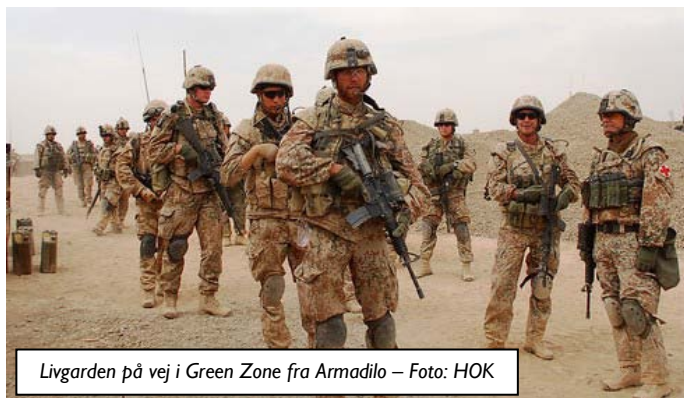
Livgarden på vej i Green Zone fra Armadillo