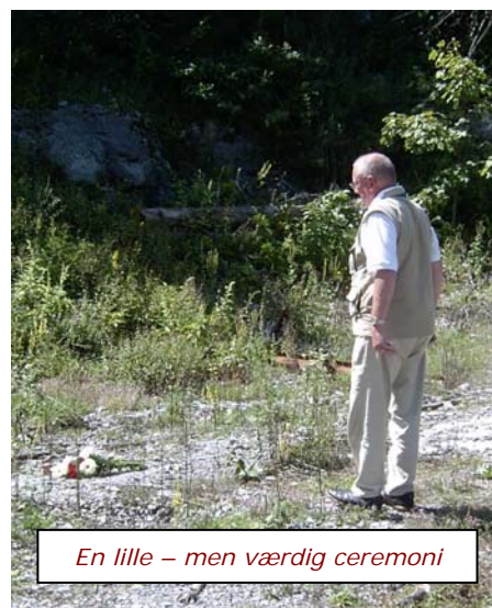
En lille – men værdig ceremoni

Tak til deltagerne for godt kammeratskab og støtte. Har man tanker og følelser, der endnu ikke er blevet bearbejdet, så gør denne tur en forskel, og med denne hjælp, ja så tror jeg tiden kan læge alle sår.